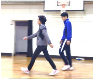
センサーを腰に巻いて測定中